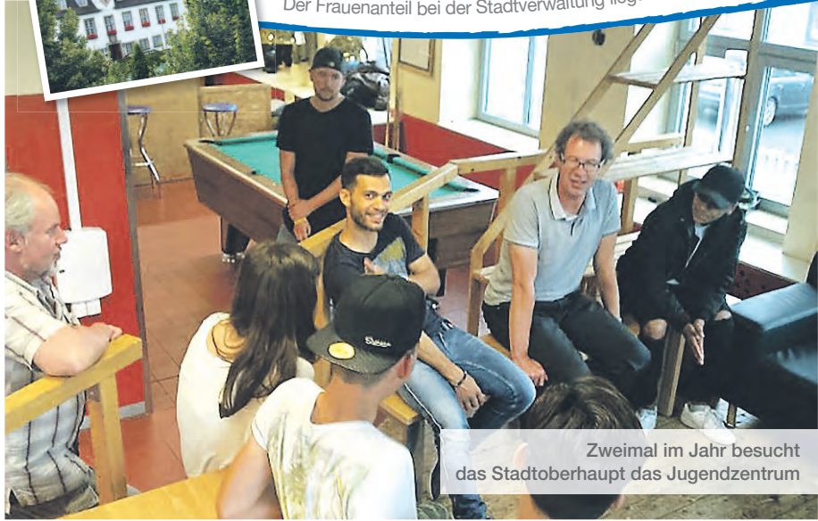
Zweimal im Jahr besucht das Stadoberhaupt das Jugendzentrum

Der Frauenanteil bei der Stadtverwaltung liegt bei mehr als 56 Prozent