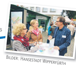
BILDER: HANSESTADT WIPPERFÜRTH

Beim Stadtfest am 18. September stellt sich die Verwaltungsspitze des Rathauses