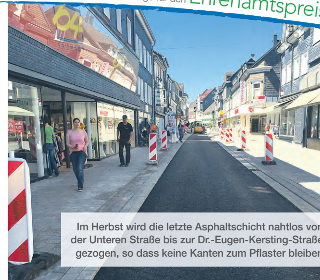
Im Herbst wird die letzte Asphaltsschicht nahtlos von der Unteren Straße bis zur Dr.-Eugen-Kersting-Straße gezogen, so dass keine Kanten zum Pflaster bleiben