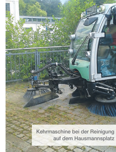
Kehrmaschine bei der Reinigung auf dem Hausmannsplatz

In Wipperfürth wachsen die Pflanzen – Öffentliche Plätze werden mit viel Aufwand gereinigt