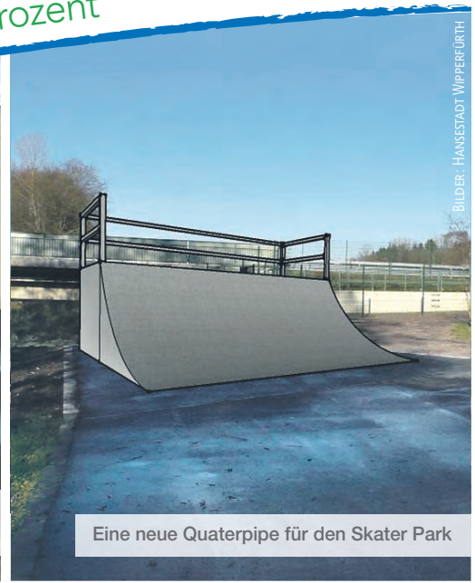
Eine neue Quaterpipe für den Skater Park